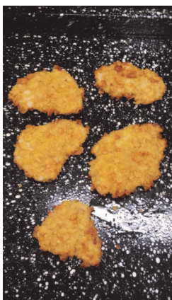
Kukoricapehelybe forgatott rántott csirkemell