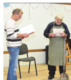
Vidám hangulatot keltettek a humoros műsorok előadói