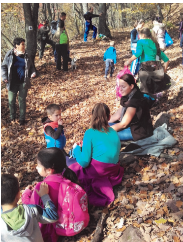
Vidám hangulatban telt az őszi kirándulás

Egyesületünk tevékenysége nem csak a labdarúgásban merül ki. Hétfőnként 18:30-tól joga, szerdánként 18:00-tól alakformáló torna, csütörtökönként 18:00-tól zumba foglalkozásokat tartunk, míg pénteken 18:00-20:00 között asztaliteniszezni lehet a Buzás Andor Művelődési Házban, melyhez a helyiséget az önkormányzat biztosítja számunkra térítésmentesen.