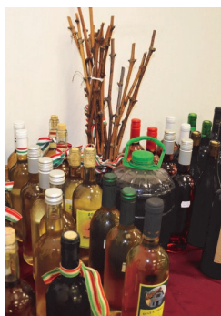
A gazdák által hozott borminták és a megszentelt vincevesszők

Vince a szőlősgazdák napja. Vidáman ülik meg ezt a napot, mert azt tartják, hogy ez a szőlővessző pálfordulója.