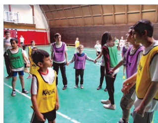
Kicsik-nagyok a sportnapon

Szintén több iskola részvételével szervezzük ebben a hónapban 3-4. osztályosainknak a hangos és értő olvasási versenyt is, természetesen Gyer-