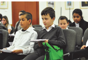
A verseny résztvevőinek egy része