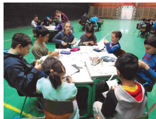
A húsvéti kézműves foglalkozáson résztvevő gyerekek

Hagyományos programjaink: Tök jó nap, Advent-karácsony ünnepkör, Víz napja projekt, Föld napja projekt, Vörös homoktó túra és kaland verseny, Hangos és értő olvasási verseny, Egészség hét, Roma nap, Gyermeknap stb.