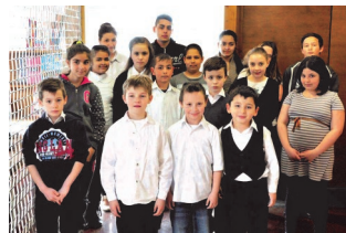
A Buzás Andor Széppolvási verseny résztvevői

kivétel nélkül minden pedagógusnak vannak egyéni fejlesztésre kiosztott óraszámai. Ekkor, még a szokottnál is kevesebb tanulóval (max. 3 fővel) tartanak egyéni fejlesztő foglalkozásokat azon tanuló számára, akik valamilyen oknál fogva igénylik ezt a fajta segítséget.