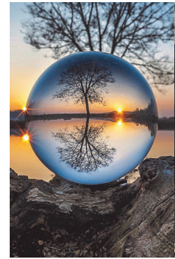
Önkormányzati rendelet a közterület tisztántartása

betartására, mely szerint belterületen, Kővágószőlős lakossága és a levegő tisztasága védelme érdekében a kerti hulladék égetése megfelelő légköri viszonyok esetén szeptember 1-től május 15-ig terjedő időszakban, szerda és szombati napokon 10.00 és 16.00 óra között lehetséges. Ünnepeken égetni tilos. Erősen párás, ködös időben, valamint szélmozgás (> 15 km/óra) esetén tilos. További rendelkezésekről a www.kovagoszolos.hu oldalon olvashatnak a Jegyzőség/Rendeletek menüpontban.