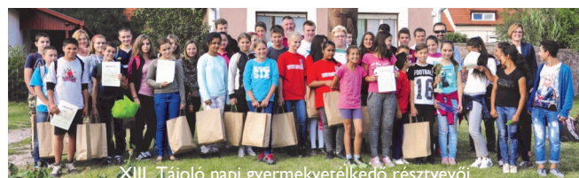
XIII. Tájéoló napi gyermekvetélkedő résztvevői

A Tájéoló Nap fontos eseménye a gyerekek számára rendezett vetélkedő. Idén a NyMTIT települések diákcsoportainak szervezett játékos szellemi vetélkedőt a helesfai csapat nyert meg, 2. a cserdiek lettek, míg a kővágószőlősi csapat a 3. helyezést érte el. Gratulálunk a csapat tagjainak!