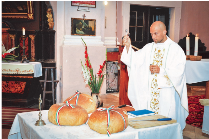
Tarjányi Zoltán írása

Augusztus 20. az egyik legrégebb magyar ünnepnap. Szent István király napja, mely a keresztény magyar államalapítás, a magyar állam ezeréves folytonosságának emlékét őrzi és élte. Nemzeti ünnep, a Magyar Köztársaság hivatalos állami- és egyben az új kenyér ünnepe is. A Katolikus egyház Szent István király, Magyarország fővédőszentje ünnepeként jegyzi. Az állami és az egyházi ünnep szándéka ma már ismét teljesen egybecseng. Ez alkalomból a kővágószőlősi önkormányzat hivatalos ünnepi programjába illetően, kenyérszenteléssel egybekötött szentmisén vettünk részt Sarlós Boldogasszony plébániatemplomunkban. A szentmise olvasmánya a Példabeszédek könyvéből volt