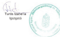
Turós Izabella Igazgató