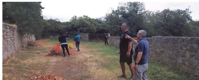
A temető kerítése mellett egy letörött, méretes gesztenyefa ágat kellett feldarabolnunk és elszállítanunk. A fa további gallyazásáról még gondoskodni fogunk.