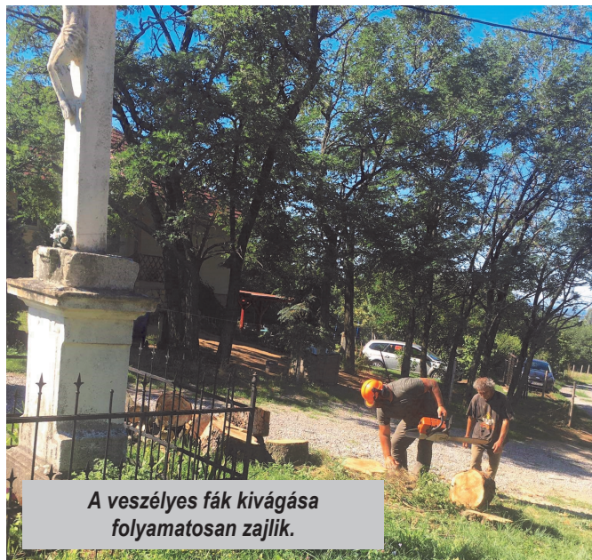
A veszélyes fák kivágása folyamatosan zajlik.