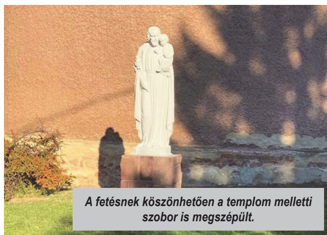
A fetésnek köszönhetően a templom melletti szobor is megszépült.