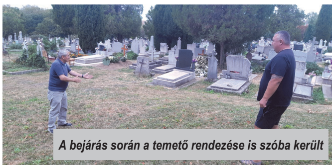
A bejárás során a temető rendezése is szóba került